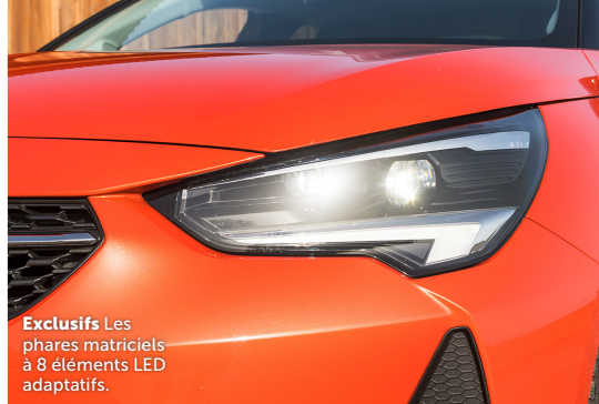
Exclusifs Les phares matriciels à 8 éléments LED adaptatifs.