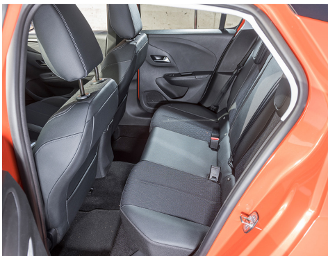
Un peu juste , l'espace sur la banquette.