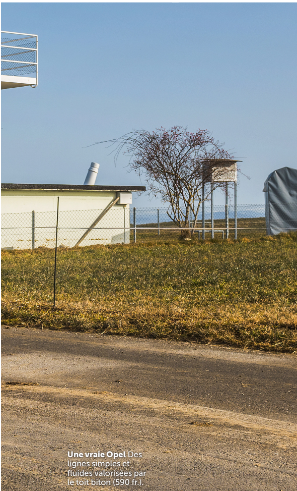
Une vraie Opel Des lignes simples et fluides valorisées par le toit biton (590 fr.)