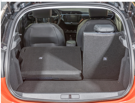
Typique , l'architecture d'un coffre de citadine.

Bien trempée , la partie arrière à la découpe travaillée. Toit plongeant et becquet arrière.