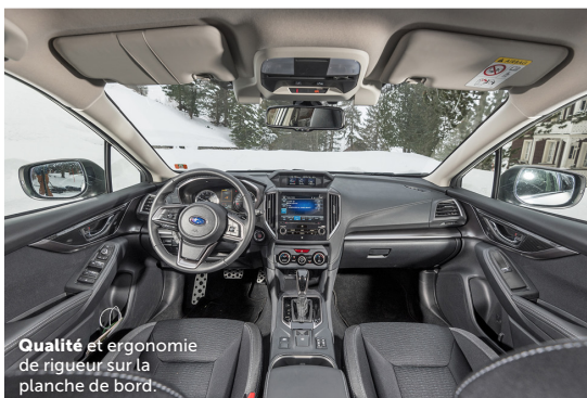
Qualité et ergonomie de rigueur sur la planche de bord.