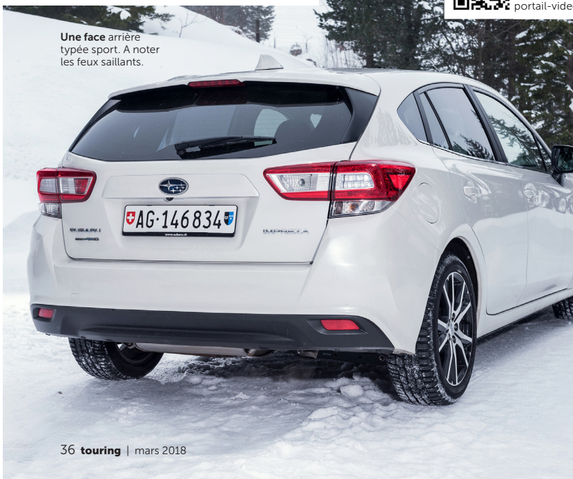
Une face arrière typée sport. A noter les feux saillants.