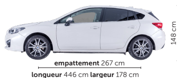
coffre: 385–1565 litres pneus: 205/50 R17, min. 205/50 R17

Le design intérieur a subi un changement radical. Jadis rustique, la planche de bord est désormais élégante, avec des matériaux de haute qualité et bien finis. Elle est dominée par un grand écran tactile, les instruments principaux encadrant un petit affichage multifonction. Bien que l'on s'y perde un peu au début, il faut concéder que l'ordre et la logique sont pleinement respectés. Les systèmes d'assistance, du régulateur de vitesse adaptatif au dispositif de freinage automatique d'urgence, font partie du viatique. Nous avons été amusés par l'aide au démarrage, qui vous exhorte à redémarrer quand les feux passent au vert.