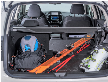
La banquette arrière divisée peut être rabattue.