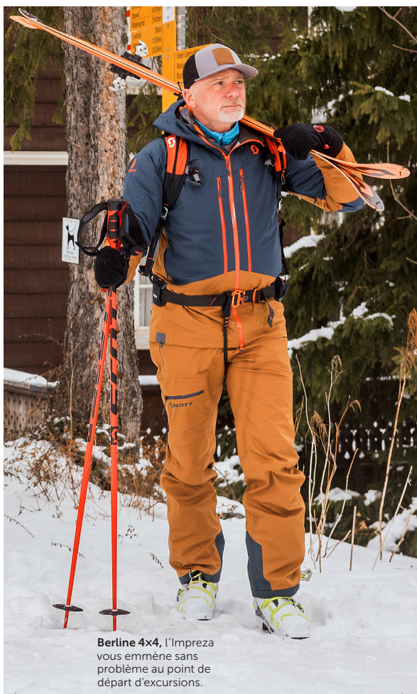
Berline 4x4, l'Impreza vous emmène sans problème au point de départ d'excursions.