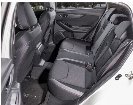
Habitabilité correcte des places arrière.