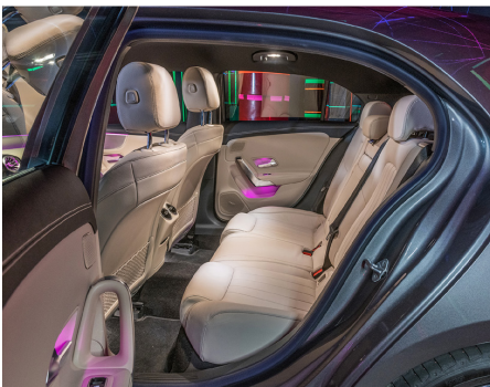
Dans la norme des compactes, sans plus.