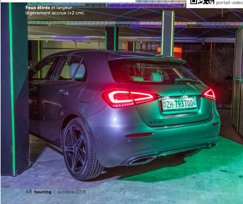
48 touring | octobre 2018