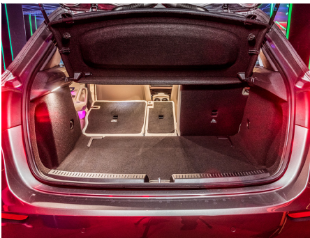
Pas immense mais accessible et bien structuré.