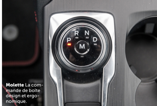
Molette La commande de boîte design et ergonomique.