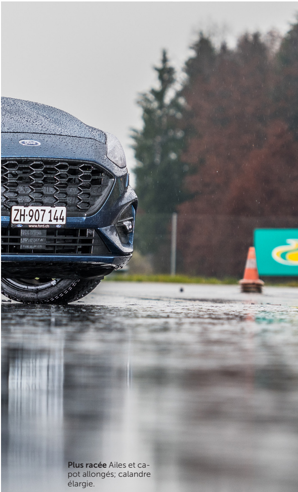
Plus racée Ailes et capot allongés; calandre élargie.