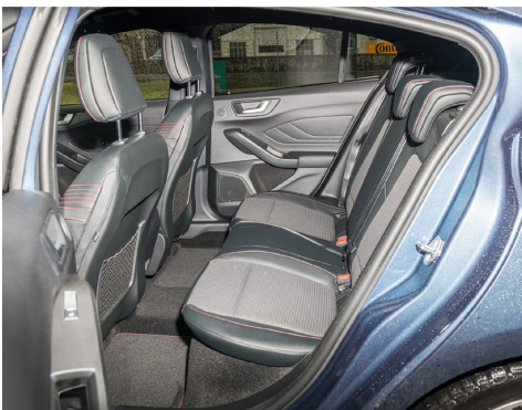
Dans la norme des voitures compactes.