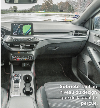
Sobriété Tant au niveau du design que de la qualité perçue.