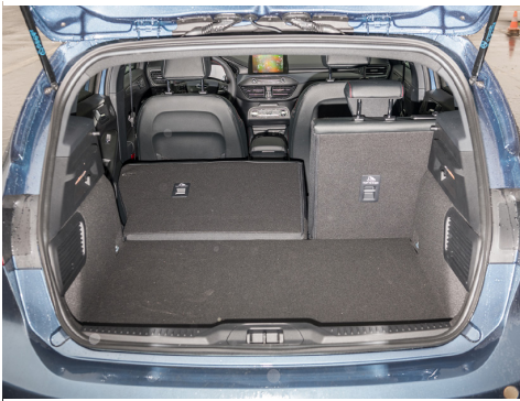
Un peu juste en raison de l'installation audio.

Large diffuseur et double échappement pour la ST Line.