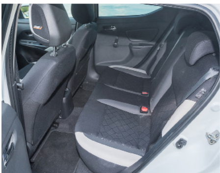
A l'arrière, les passagers sont à l'étroit.