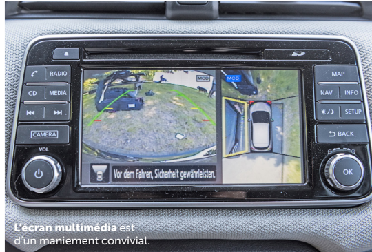
L'écran multimédia est d'un maniement convivial.