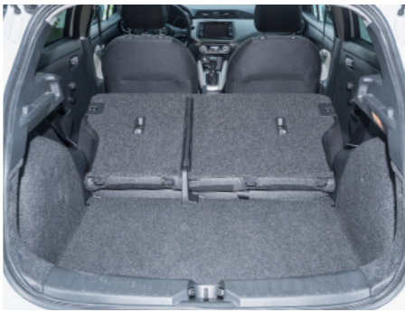
Une modularité à l'ancienne jugée suffisante.

Le style hardi de la Micra de 5e génération fait très bonne impression.