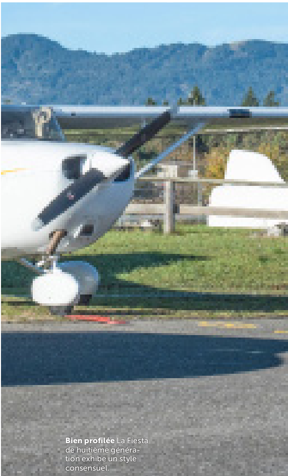
Bien profilée La Fiesta de huitième génération exhibe un style consensuel.