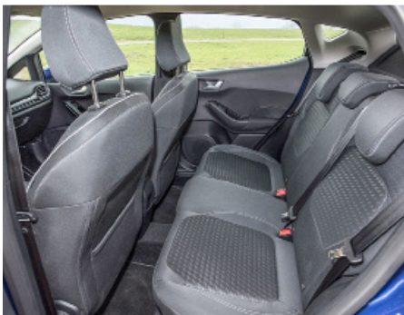
Un peu juste, l'espace sur la banquette.