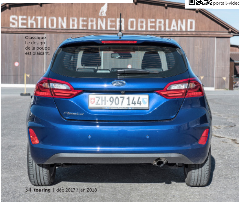
Classique Le design de la poupe est plaisant.