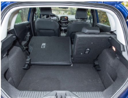
Modularité sans surprise pour une citadine.