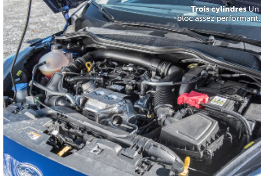
Trois cylindres Un bloc assez performant.